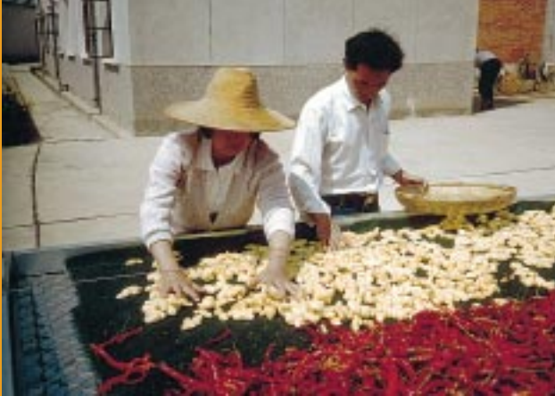
Gewürztrocknung in China Drying of spices in China