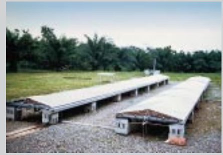
Trocknung in Indonesien selbst in der Regenzeit Drying even in rainy season (Indonesia)