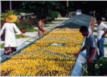
Bananentrocknung in Thailand Drying of banana in Thailand