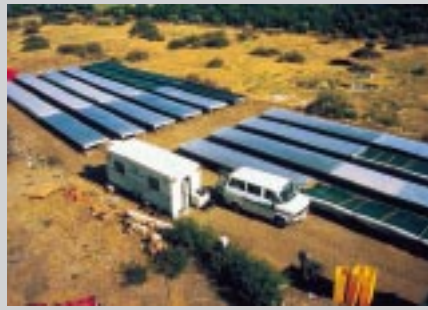
Selbst große Produzenten setzen den Tunneltrockner ein Even large producers use the tunnel dryer