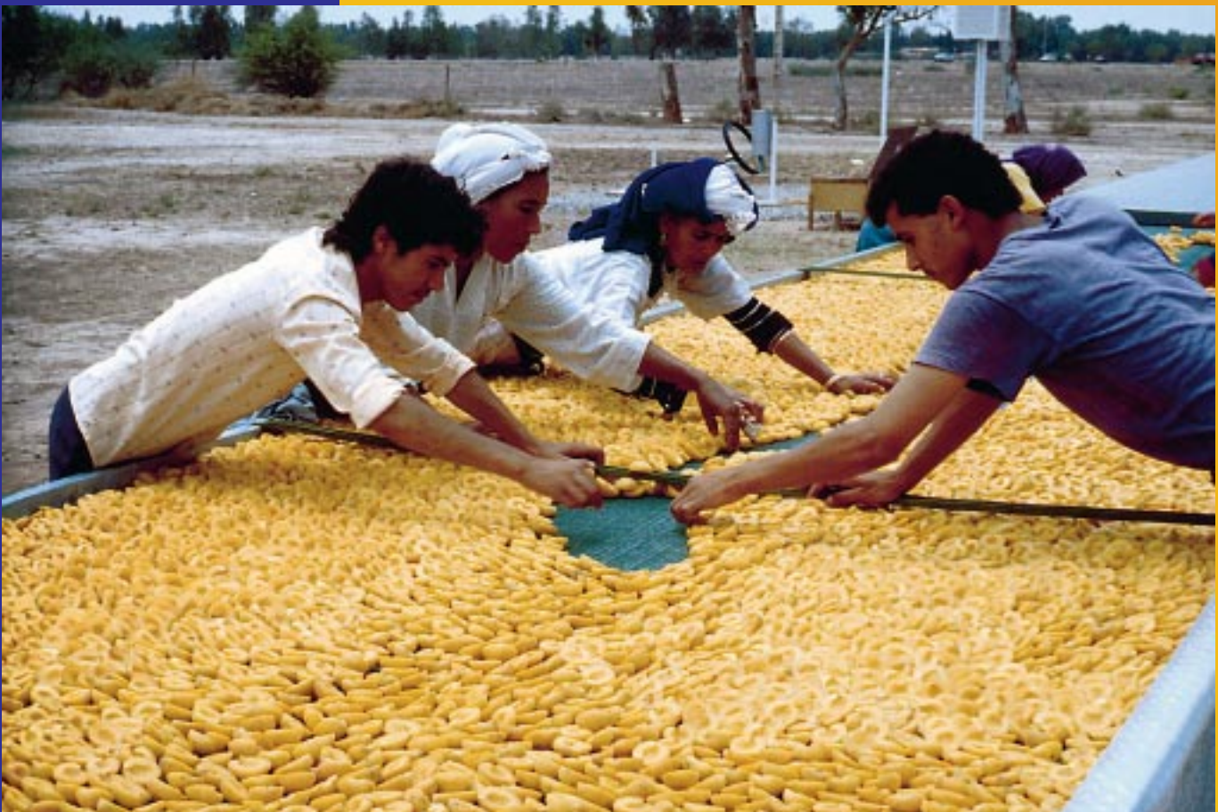
Der solare Tunneltrockner im Einsatz/Solar tunnel dryer in operation

die Erzeugung hochwertiger Produkte in landwirtschaftlichen Betrieben geeignet. Als gemeinsame Entwicklung des Instituts für Agrartechnik in den Tropen und Subtropen der Universität Hohenheim und der Firma Innotech sind solare Tunneltrockner des „Typ Hohenheim“ in über 40 Ländern im Einsatz.